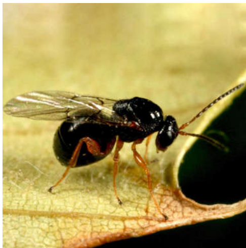
Slika 11. Odrasla jedinka ose šiškariće (Web 11)

Kestenova osa šiškarića dolazi iz porodice Cynipidae, a porijeklom je iz Kine. U Europi je prvi puta zabilježena 2002. godine, a u Hrvatskoj se pojavila 2010. godine. Ova vrsta je vrlo invazivni nametnik na vrstama iz roda Castanea . Naziv šiškarića dobila je zbog stvaranja šiški na listovima i izbojcima pitomog kestena. Ova vrsta je monofagna i razmnožava se jednom godišnje i to partenogenetski. Odrasla ženka veličine je 2,5 – 3 mm, te ima crno tijelo i smeđe noge (Slika 11). Životni vijek odrasle ženke je vrlo kratak, oko 10 dana. Jajašca su bijele boje i polaže ih u pupove kestena, najčešće 30-40 jaja po pupu, a odlaganje se odvija od sredine lipnja do kraja srpnja. Nakon otprilike mjesec dana iz jajašaca izlažu se ličinke (Slika 11) koje prezimljavaju unutar pupa i tek u proljeće počinju s rastom. U proljeće s početkom rasta pupa, ličinke potiču rast „šiške“. Šiške mogu biti zelene ili ružičaste boje i veličine 0,5 – 4 cm. Unutar šiški postepeno se razvijaju ženke ose koje izlaze van, tijekom lipnja i srpnja, kroz izlazne rupe koje se mogu jasno vidjeti. I tako se nastavlja krug širenja i razmnožavanja jer odrasle jedinke odlažu jaja u pupove. Osa šiškarića može se širiti aktivno i pasivno. Aktivno se širi letom, a pasivno transportom i to najčešće zaraženim sadnicama (Matošević, 2012).