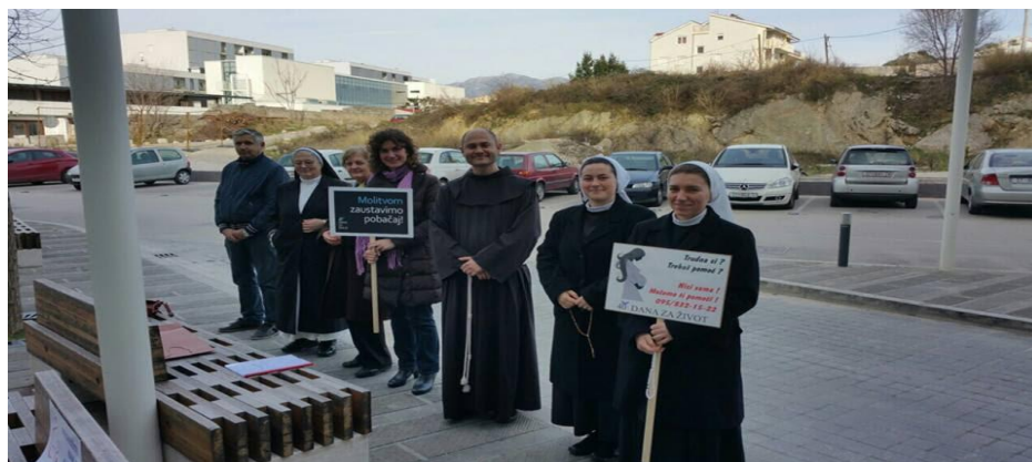
Slika molitelja ispred splitskog rodilišta za vrijeme jesenskog bdijenja 128

Udruga Hrvatska za život pod kojom djeluje Inicijativa 40 dana za život organizira od 2016. godine Tjedan za život koji se održava u Zagrebu. Tjedan je bogat Pro Life programom. Na kraju tjedna se organizira okrugli stol na kojem sudjeluju i Pro choice udruge.