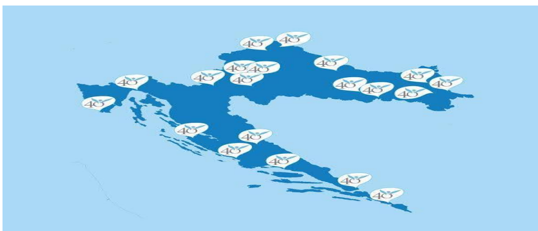
Slika gradova u kojima je zaživjela inicijativa 127

Iako su molitelji nebrojeno puta bili napadani, i verbalno i fizički to ih nije spriječilo u njihovoj molitvi. Molitva je prva crta majkama koje su se možda našle u situaciji koja za njih trenutno izgleda bezizlazna. Upravo su zato molitelji tu, da u prvom trenu ako im se žena obrati, porazgovaraju s njom, utješe je, usmjere je na pomoć koja joj je potrebna.