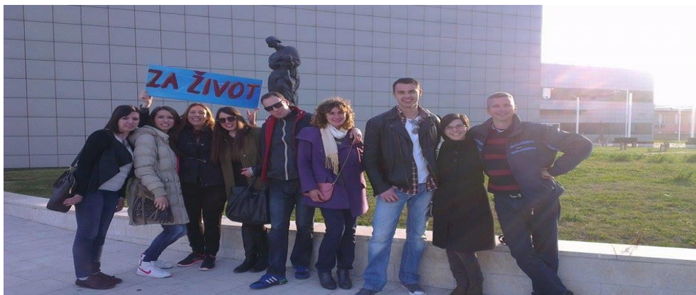
Slika voditelja Inicijative 40 dana za život ispred splitskog rodilišta.