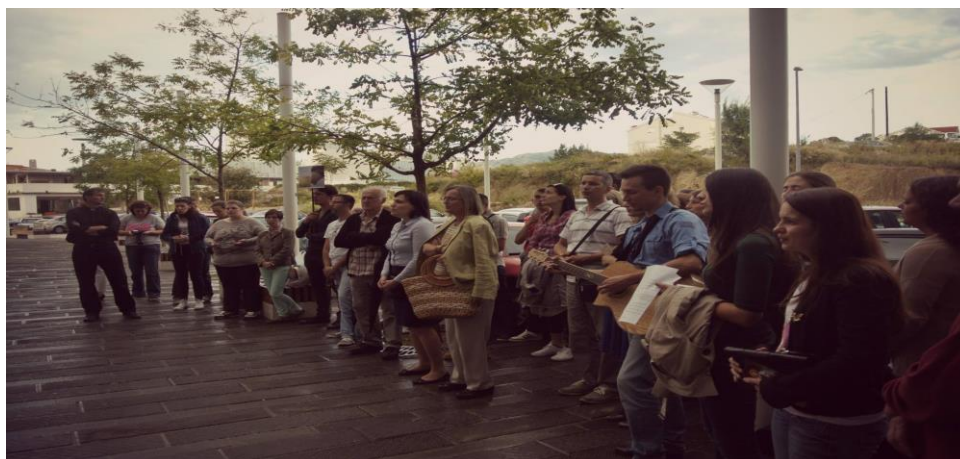
Slika molitelja ispred splitskog rodilišta za vrijeme korizmenog bdijenja