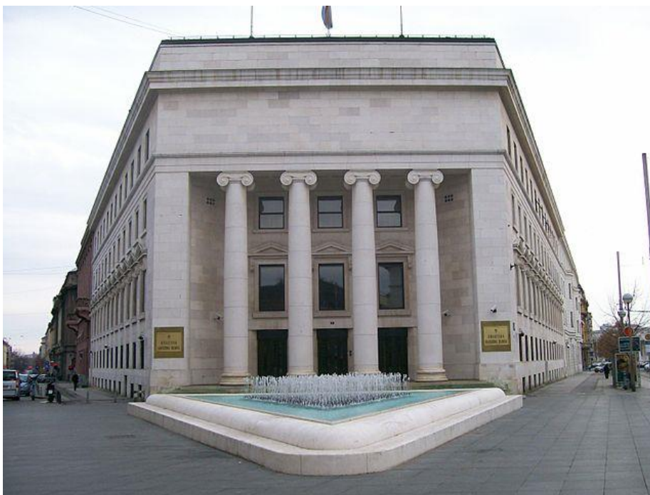
Slika 3 Hrvatska narodna banka https://hr.wikipedia.org/wiki/Hrvatska_nardna_bank Pristup 15.09.2024.