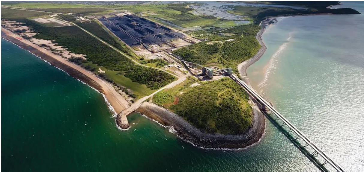
Slika 11 https://www.adanienterprises.com/en/businesses/mining-and-mdo/australia Pristup 17.09.2024.

Vodstvo HSBC plc treba s oprezom pristupiti širenju poslovanja u Indiji. Njezinim ulaskom na novo tržište javio se reputacijski rizik zbog suradnje s jednim od najvećih investitora kojeg se tereti za izbjegavanje poreznih obveza, te burzovne špekulacije. Radi se vlasniku Adani Grupe koji slovi za najvećeg indijskog investitora u distribuciju zelene energije, električne energije, zrakoplovnu industriju. Problem povezanosti Adani Grupe i HSBC-a jasno se može razaznati. „Zabrinuti smo da bi mogla postojati rupa u novoj politici, onoj koja bi im omogućila da podrže kontroverzni projekt rudarenja ugljena Adani Carmichael u Australiji. Ako se izgradi, to bi bio jedan od najvećih rudnika ugljena na svijetu, dodajući milijarde tona ugljičnog dioksida u našu atmosferu baš kad nam znanstvenici govore da moramo brzo smanjiti emisije.“ 13 Sam Adani odbacio je optužbe dok je grupa čak izdala službeno priopćenje na gotovo 413 stranica. Povezanost HSBC-a s financiranjem Adanijeve grupe te financiranje izgradnje najvećeg svjetskog rudnika ugljena naišla je na osudu zbog kršenja ranije potpisanog pariškog sporazuma te neusklađenosti s međunarodnim ESG zahtjevima.