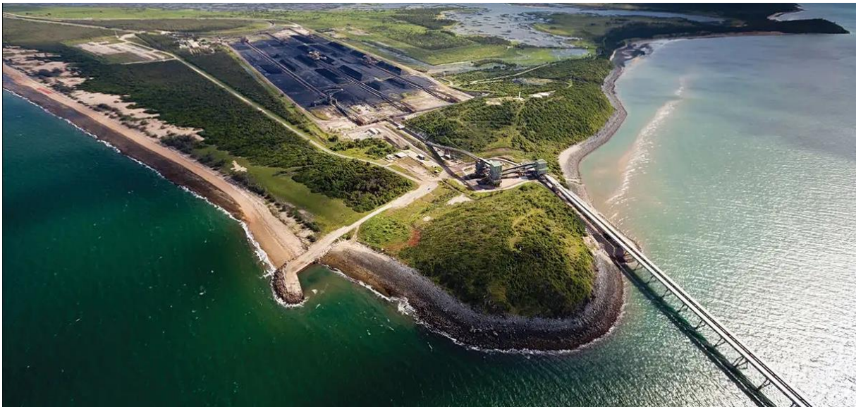
Slika 11 https://www.adanienterprises.com/en/businesses/mining-and-mdo/australia Pristup 17.09.2024.

Vodstvo HSBC plc treba s oprezom pristupiti širenju poslovanja u Indiji. Njezinim ulaskom na novo tržište javio se reputacijski rizik zbog suradnje s jednim od najvećih investitora kojeg se tereti za izbjegavanje poreznih obveza, te burzovne špekulacije. Radi se vlasniku Adani Grupe koji slovi za najvećeg indijskog investitora u distribuciju zelene energije, električne energije, zrakoplovnu industriju. Problem povezanosti Adani Grupe i HSBC-a jasno se može razaznati. „Zabrinuti smo da bi mogla postojati rupa u novoj politici, onoj koja bi im omogućila da podrže kontroverzni projekt rudarenja ugljena Adani Carmichael u Australiji. Ako se izgradi, to bi bio jedan od najvećih rudnika ugljena na svijetu, dodajući milijarde tona ugljičnog dioksida u našu atmosferu baš kad nam znanstvenici govore da moramo brzo smanjiti emisije.“ 13 Sam Adani odbacio je optužbe dok je grupa čak izdala službeno priopćenje na gotovo 413 stranica. Povezanost HSBC-a s financiranjem Adanijeve grupe te financiranje izgradnje najvećeg svjetskog rudnika ugljena naišla je na osudu zbog kršenja ranije potpisanog pariškog sporazuma te neusklađenosti s međunarodnim ESG zahtjevima.