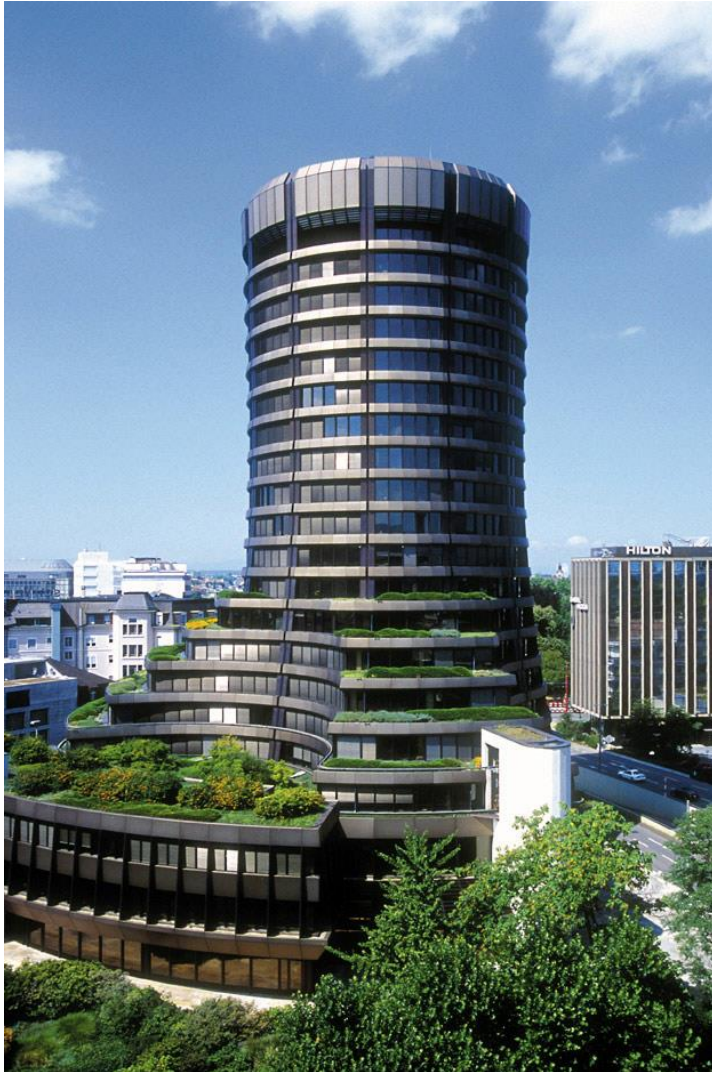
Slika 1 Zgrada Baselskog odbora – Švicarska https://www.riskcompliance.biz/news/finalising-basel-iii-reforms/ Pristup 20.09.2024.