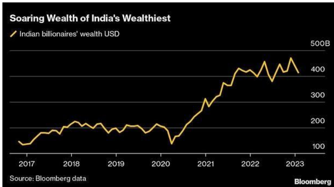
Slika 10 Strelovit rast indijskog sloja bogatih https://www.reuters.com/markets/deals/indias-lt-says-hsbc-buy-its-mutual-fund-arm-425-mln-2021-12-23/ Pristup 25.07.2024.