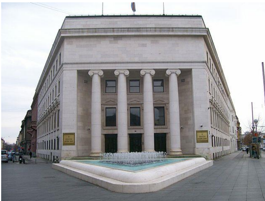
Slika 3 Hrvatska narodna banka https://hr.wikipedia.org/wiki/Hrvatska_nardna_banka Pristup 15.09.2024.