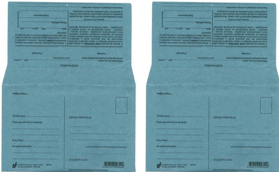
Slika 4 – Plava dostavnica s povratnicom

Ako se ni ta ponovljena dostava ne uspije obaviti, dostava će se obaviti isticanjem pismena koje je trebalo dostaviti na mrežnoj stranici e-oglasna ploča sudova 35 . Nakon osam dana od dana objave smatra se da je dostava obavljena, tj. uredna, i postaje pravomoćna te tako proizvodi pravne posljedice.