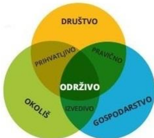
Slika 1: Stupovi održivog razvoja

Cilj održivog razvoja je trojak. On teži gospodarskoj učinkovitosti (ekonomskom razvoju) , društvenoj odgovornosti (socijalnom napretku) i zaštiti okoliša . Tri prethodno navedene stavke se još popularno nazivaju i stupovima održivog razvoja.