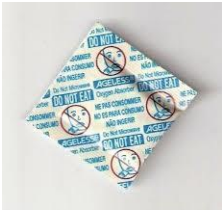
Slika 11: Slika: „Ageless“ hvatač kisika

„Ageless“ hvatači kisika su vrećice tvrtke Mitsubishi Gas Chemical, koje apsorbiraju kisik iz zraka. Mogu se koristiti za različite primjene, uključujući hranu, tekstil i elektroniku. Zbog toga što održavaju razinu kisika ispod 0,1 vol. %, štite od štetoina i sprječavaju oksidaciju ulja / masti, promjene u boji i mikrobiološki rast, što rezultira poboljšanom kvalitetom proizvoda i produženim rokom trajanja.