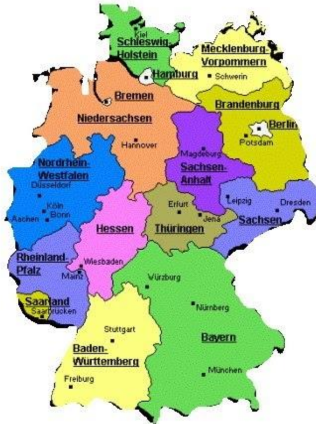
Slika 3. 16 saveznih zemalja Njemačke

središnje države u zemljama OECD -a iznosili su čak 45,8%. Što se tiče broja zaposlenih, samo 10% od ukupnog broja zaposlenih u njemačkoj javnoj upravi zaposleno je u saveznoj vladi. To jasno pokazuje da je vlada niže razine vlada koja učinkovito pruža usluge građanima. Kao dodatni dokaz, dovoljno je pokazati da se 75% saveznog i državnog zakonodavstva provodi na lokalnoj razini, kao i zakonodavstvo EU "(Manojlović, 2015.). Sljedeća slika prikazuje podjelu Njemačke na savezne države.