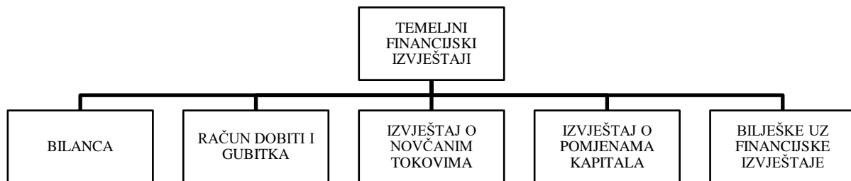
Slika 3: Temeljni financijski izvještaji

Osnovna je zadaća računovodstva kao uslužnog sustava unutar poduzeća koja je potrebna za vođenje poslovanja poduzeća upravo skupljanje i obrada podataka te prikazivanje informacija zainteresiranim korisnicima. Posljednju fazu računovodstvenog procesiranja predstavljaju financijski izvještaji.