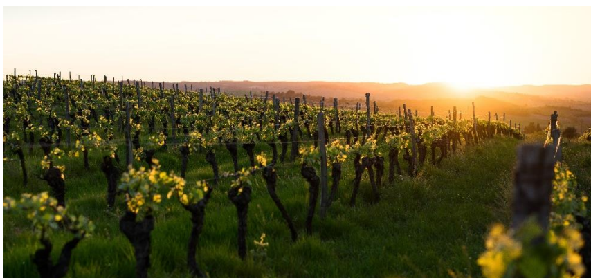
Slika 2 Moslavački škrlet

Podregija Moslavina smještena je oko Moslavačke gore. U njoj se uzgajaju autohtone sorte škrlet, frankovka, graševina, moslavac, pinot bijeli i sivi, razling rajnski... Najveći vinogradi su Voloder i Ivanić-Grad (1400 ha) te Čazma i Garešnica (580 ha), prema Gašparec-Skočić & Bolić (2006). U ovoj podregiji se nalaze i brojni manji vinogradi. Tlo je uglavnom ilovasto, klima je kontinentalna s godišnjom količinom oborina do 800mm. Posebnost na ovom području je škrlet, bogato autohtono vino.