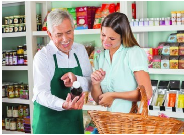
Slika 3: Odnos kupac prodavač

iako je možda čak i malo skuplji od nekog drugog ili ako su kvaliteta i kvantiteta jednake kod jednih i drugih operatera.