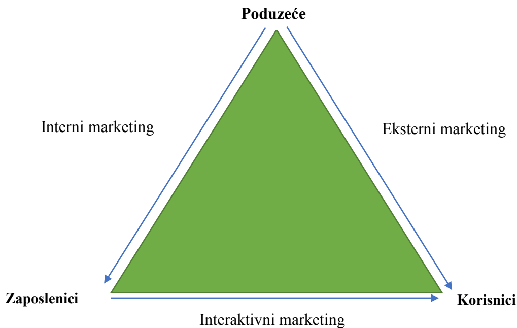
Slika 4: Trokut uslužnog marketinga