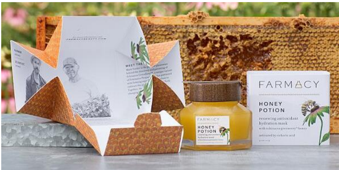
Slika 8: Primjer održive ambalaže tvrtke Natural Farmacy

Kao drugi primjer može se navesti kompanija za proizvodnju prirodne kozmetike - Natural Farmacy. Ista je osvojila nekoliko nagrada za svoju kutiju koja je inspirirana ključnim sastojkom proizvoda - medom. Šesterokutni dizajn podsjeća na saće i otvara se poput cvijeta, cijela kutija je napravljena od jednog komada kartona, što olakšava da se kasnije lako spljošti i reciklira. Također, umjesto dodavanja umetka s informacijama brenda, priča o brendu je tiskana u unutrašnjosti kutije.