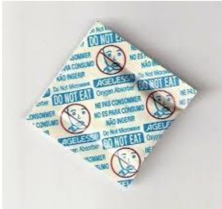
Slika 11: Slika: „Ageless“ hvatač kisika

„Ageless“ hvatači kisika su vrećice tvrtke Mitsubishi Gas Chemical, koje apsorbiraju kisik iz zraka. Mogu se koristiti za različite primjene, uključujući hranu, tekstil i elektroniku. Zbog toga što održavaju razinu kisika ispod 0,1 vol. %, štite od štetoina i sprječavaju oksidaciju ulja / masti, promjene u boji i mikrobiološki rast, što rezultira poboljšanom kvalitetom proizvoda i produženim rokom trajanja.