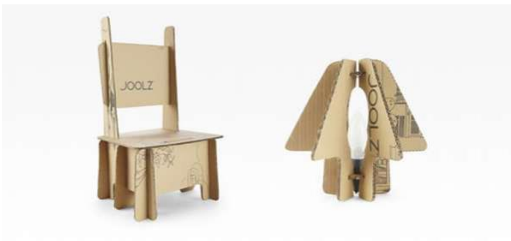
Slika 7: Primjer održive ambalaže tvrtke Joolz

Jedan od dobrih primjera svakako je kompanija za proizvodnju dječjih kolica Joolz. Ona isporučuje svoje proizvode u ambalaži koja sadrži tiskane upute kako pretvoriti karton u razne predmete koji se kasnije mogu koristiti, poput stolica, kućica za ptice ili čak sjenila za lampice. Također, umjesto zasebnog komada papira, tiskane upute se nalaze na kutiji.