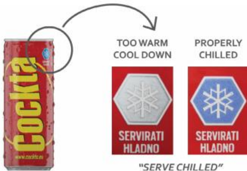
Slika 12: Indikator topline

Indikatori mogu pružiti kvalitativne ili polukvantitativne vizualne informacije o upakiranoj hrani pomoću promjene boje (npr. promjena u intenzitetu obojenja ili nepovratna promjena boje). Mogu se koristiti za pružanje informacija o temperaturi, prisutnosti plina i hlapivih tvari, promjeni pH i mikrobiološkog onečišćenja. Za razliku od senzora, indikatori ne mogu pružiti kvantitativne podatke i ne mogu pohraniti izmjerene podatke.