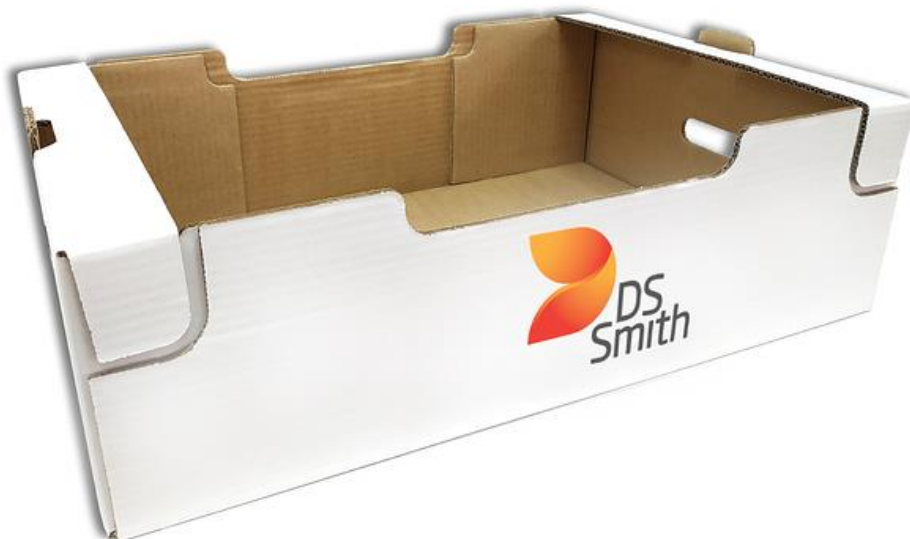
Slika 4: Kartonska ambalaža za voće i povrće

Pametno osmišljena ambalaža produžuje rok trajanja namirnicama te tako i smanjuje otpad hrane. Kartonska ambalaža za voće i povrće može izaći u susret mnogim izazovima. Ona je dostupna u različitim varijantama; čvrsta je, ergonomska i prilagodljiva; biorazgradiva i 100% reciklirajuća; održava svježinu proizvoda do 3 dana dulje od ostale ambalaže; te omogućuje besplatnu promociju brenda kroz atraktivan dizajn kutije.