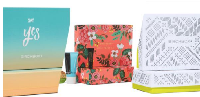
Slika 9: Primjer održive ambalaže tvrtke Birchbox