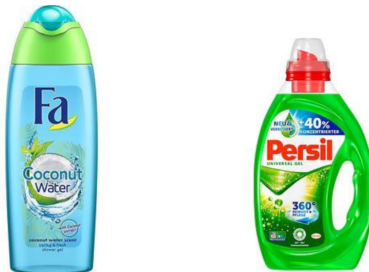
Slika 6: Primjeri Henkelove ambalaže od recikliranog PET-a

Tekućine poput gelova za tuširanje i deterdženata pakiraju se u ambalaže od recikliranog PET-a. To podrazumijeva godišnju uštedu od oko 200 tona novog PET materijala. Ugljični otisak reciklirane PET plastike je 80% niži u odnosu na sličnu novu plastiku. Zahvaljujući većoj koncentraciji formulacije i novom dizajnu boca za tekuće deterdžente za pranje rublja kao što je Persil, Henkel je uspio smanjiti ambalažu za 3.500 tona na godišnjoj razini, a navedena ambalaža se u potpunosti može reciklirati.