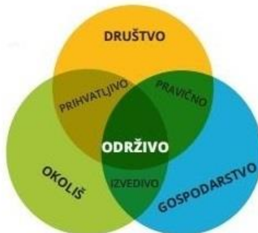
Slika 1: Stupovi održivog razvoja

Cilj održivog razvoja je trojak. On teži gospodarskoj učinkovitosti (ekonomskom razvoju) , društvenoj odgovornosti (socijalnom napretku) i zaštiti okoliša . Tri prethodno navedene stavke se još popularno nazivaju i stupovima održivog razvoja.