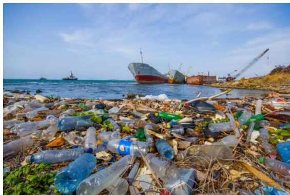
Slika 3: Plastika u oceanu

Svijest se počinje mijenjati nakon tzv. „Plavog efekta planete“. Znanstvenici i stručnjaci tvrde kako je pitanje plastike poznato već duže vrijeme, no široj javnosti nije bilo poznato koliko plastike ima u oceanima, niti koliki je njezin utjecaj na morski svijet. Premijerno prikazana 2001. godine, BBC-jeva dokumentarna serija Blue Planet otkrila je zabrinjavajuću stvarnost zagađenja naših oceana plastikom, te prvi puta postavila to pitanje u javnosti. Nakon toga izašao je Blue Planet II , također BBC-jev dokumentarac, emitiran 2018. godine koji je bio veliki hit i katalizator u osvješćivanju javnosti o zagađenju našeg okoliša.