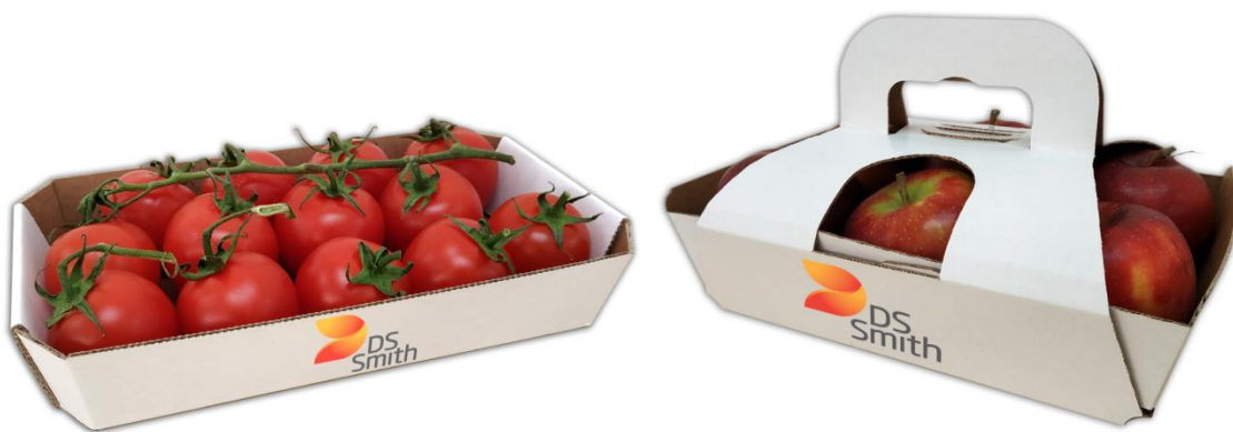
Slika 5: Primjeri ambalaže za voće i povrće

U posljednje vrijeme, industrija voća i povrća kreće se prema modelu kružnog gospodarstva. U kružnom gospodarstvu vrijednost proizvoda, materijala i resursa održava se što je duže moguće. To znači da dolazi do pravog pomaka prema korištenju obnovljivih izvora energije, uklanjanju toksičnih kemikalija i odlaganju otpada.