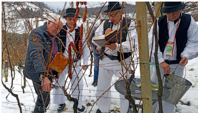
Slika 6 Vincekovo

„Ponegdje se prvi posjet vinogradima u novoj godini obavi već za blagdan Triju kraljeva, ali najprikladniji nadnevak za to je 22. siječnja, na spomendan Sv. Vinka, Vinceka, Vincencija, Vinceška ili kako se u pojedinom kraju naziva taj svetac“ (Gašparec-Skočić, Bolić, 2006:263). Tog dana se vinova loza pošškropi starim vinom i o trs objese kobasice, kulen, slanina i još razne delicije. Tim običajem se simbolično izaziva plodnost u narednoj godini. Uz to, odreže se nekoliko mladica koje se stave u posudu s vodom, kako bi se nakon izbijanja izdanaka prorekla iduća vinska godina. Obredi se razlikuju od kraja do kraja. U Iloku se Vincekovo slavi ujutro, dopodne, vinogradi se tada blagoslivljaju i održava se sveta misa, a o trs se objese npr. ljute srijemske kobasice. Slično je i u erdutskim, orahovičkim te đakovačkim vinogradima. U gotovo svim vinogradima se na spomendan sv. Vinka održava neki obred. Domaćin često drži govor pred ljudima koji su se našli u njegovom vinogradu. „Ja tebe darivam vinom, a ti mene novim grožđem i moštom“ (Gašparec-Skočić, Bolić, 2006:263). Prvi dio ceremonije održava se u otvorenom vinogradu, a drugi se odvija u vinskim podrumima.