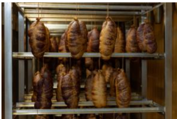
Slika 6. Prikaz gotovih kulena koji se nalaze u Kući Baranjskog kulena