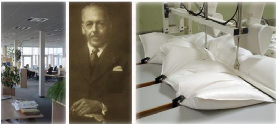
Slika 5. Hanseatic Brend