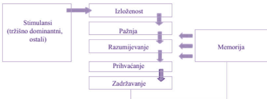
Slika 2. Proces prerade informacija

Informacije s tržišta o ponudi drugih tržišnih subjekata su jedan od vanjskih činitelja koji modificira ponašanje krajnjeg potrošača. Te informacije mogu doći od prijatelja i znanaca koji svoje savjete temelje na vlastitom iskustvu i stvorenom mišljenju tijekom potrošnje proizvoda, odnosno korištenja usluga. 9 Prerada informacija je početna faza u procesu donošenja odluke u kupnji i stoga je od izuzetnog značaja za strategiju promotivnih aktivnosti. Prerada informacija prolazi kroz nekoliko faza kako je prikazano na slici 2.