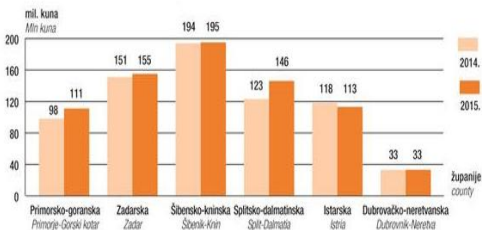
Graf 2: Ostvareni prihod luka nautičkog turizma bez PDV-a u 2014. i 2015.g.