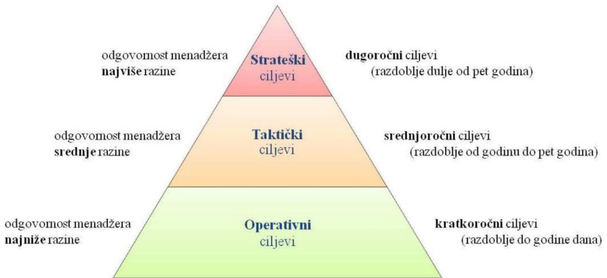
Slika 1. Odnos između ciljeva i hijerarhije u poduzeću