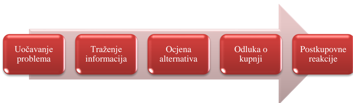
Slika 4. Proces donošenja odluke o kupovini

Proces donošenja odluke o kupnji je proces kroz koji prolaze osobe koje su odlučile kupovati neki proizvod/uslugu, a taj je proces pod utjecajem mnogih čimbenika i marketinških aktivnosti poduzetničkog subjekta (Grbac i Meler, 2007).