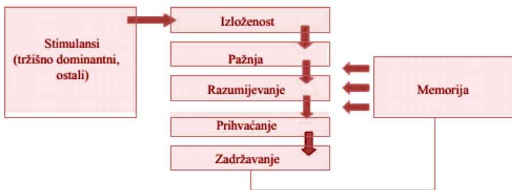
Slika 2. Proces prerade informacija

Prema Kesić (2006) prerada informacija je početna faza u procesu donošenja odluke u kupnji i stoga je od izuzetnog značaja za strategiju promotivnih aktivnosti. Prerada informacija prolazi kroz nekoliko faza kako je prikazano na slici 2.