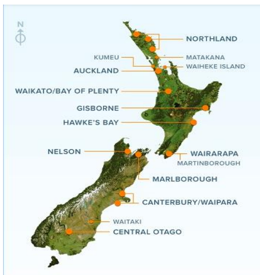
Slika 4: Prikaz lokacija najvažnijih vinskih regija na Novom Zelandu