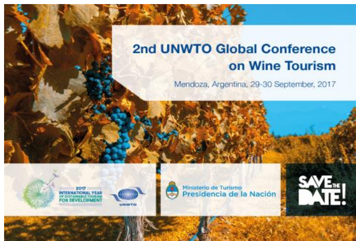
Slika 1: Pozivnica za drugu UNWTO Globalnu Konferenciju za Enološki Turizam

Sljedeća konferencija se organizira u suradnji Ministarstva turizma Argentine i UNWTO-a. Održavati će se od 29.rujna do 30.rujna u pokrajini Mendoza, Argentina. 29