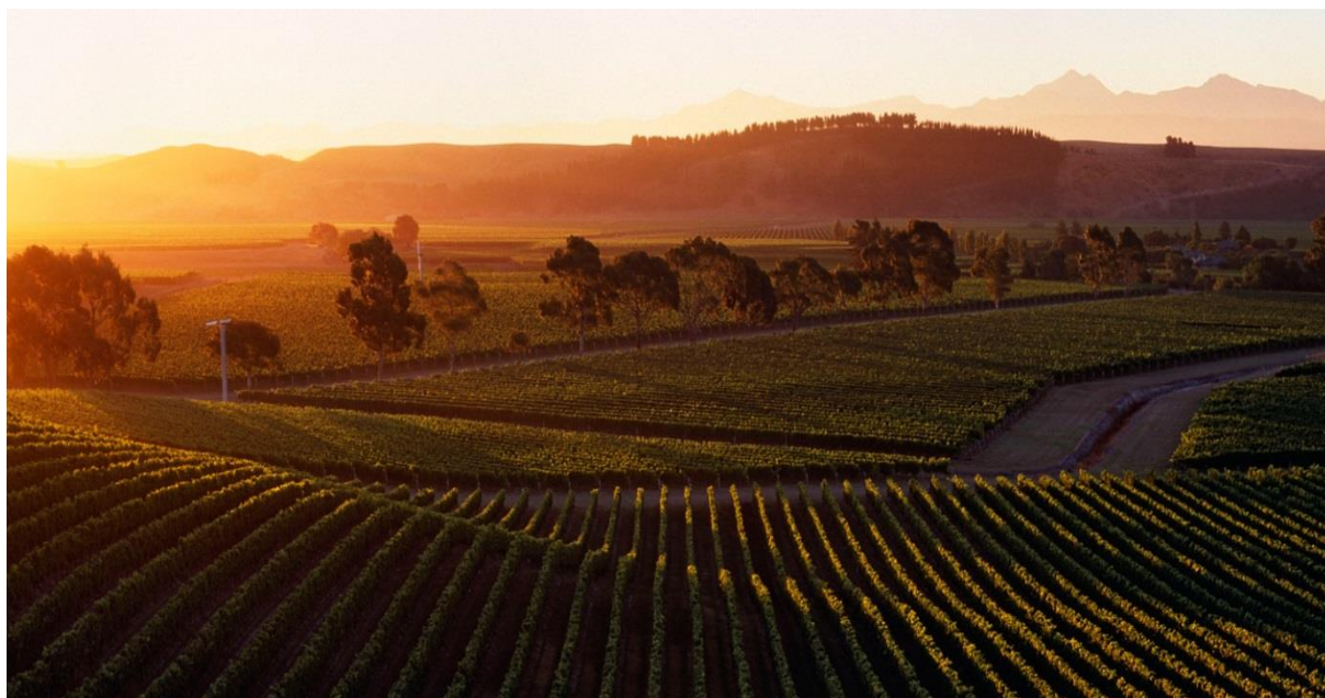
Slika 3: Vinograd Marlborough regije

Unikatan geografski položaj uvelike je utjecao na kvalitetu vina s obzirom na to da su najveći problemi kod kultivacije 42 izazvani klimatskim uvjetima. Položaj Novog Zelanda pruža velike prednosti ali i prepreke. Naime, iako ljeta nisu previše topla, a zime su hladne, velike količine oborina uzrok su mnogih gljivičnih oboljenja.