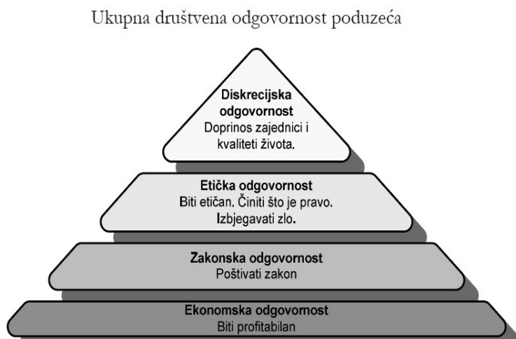
Slika 5. Hijerarhija društvene odgovornosti poduzeća (Daft, 1997, 154)

Razlikujemo četiri razine društveno odgovornog poslovanja koje imaju svoju hijerarhiju i dijele se ovisno o njihovoj veličini i tome koliko im često menadžeri pristupaju prilikom donošenja poslovnih odluka. 64