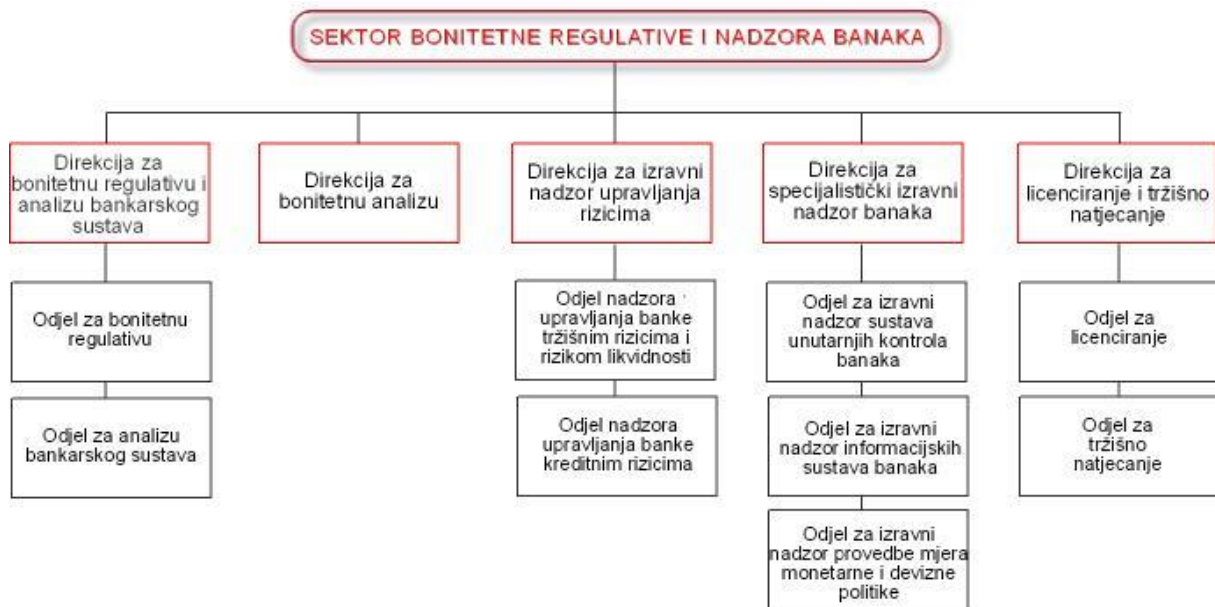
Slika 2. Shematski prikaz Direkcija unutar Sektora bonitetne regulative i nadzora banaka