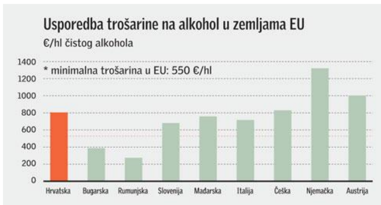
Slika 1 – usporedba trošarine na alkohol u zemljama EU