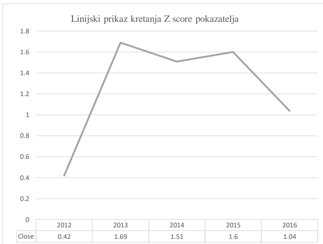
Graf 2. Linijski prikaz kretanja Z-score pokazatelja 2012.-2016

Izvor: Interni podaci poduzeća Draga Sadra, d.o.o., Sinj