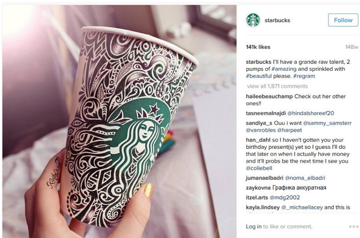
Slika 3: Primjer Starbucksovog natječaja

imaju više "followera" da im pomognu s promocijom njihovih proizvoda, tako što će oni objavljivati slike u njihovoj odjeći, slike njihove hrane, prodajnog mjesta ili nečega sličnog. Korisnici Instagrama svakodnevno objavljuju slike iz svog privatnog života, aktivno prate što njihovi prijatelji objavljuju, pa čak i oni koje ne prate ako su postavili opciju da imaju otvoreni profil, tj. da njihove slike mogu vidjeti i oni koji ih ne prate. Sve češće se na Instagramu u posljednje vrijeme viđaju i stranice za prodaju, ljudi sami osmisle neki poduzetnički pothvat, naprave Instagram stranicu gdje oglašavaju svoje proizvode i nude mogućnost narudžbe preko Instagram Directa (opcija na Instagramu koja nudi mogućnost direktnog slanja slike, poruke određenoj osobi, ili više njih). Komunikacija preko Instagrama je vrlo jednostavna u poslovnom i privatnom smislu. Opuštenija je, ljudi imaju pristup u tuđi život gledajući njihove slike, mogu steći dojam o tome kakva je netko osoba i što voli.