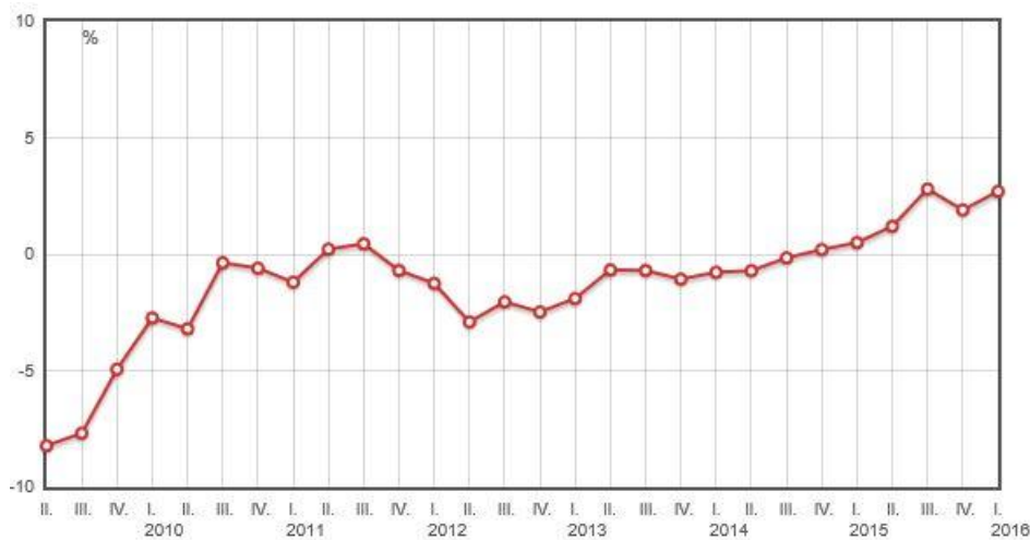
Graf 2: Tromjesečni obračun BDP-a

Europska komisija ocijenila je da Hrvatska ne ispunjava kriterij javnih financija i s obzirom na tu ocjenu postoji rizik da Hrvatska neće ispuniti odredbe Pakta o stabilnosti i rastu. Razlog tome je prekomjerni deficit, te se smatra da on neće dovoljno pasti te da će u 2017. godini biti potrebne dodatne mjere za osiguravanje ispunjivanja odredbi gore navedenog Pakta. 30