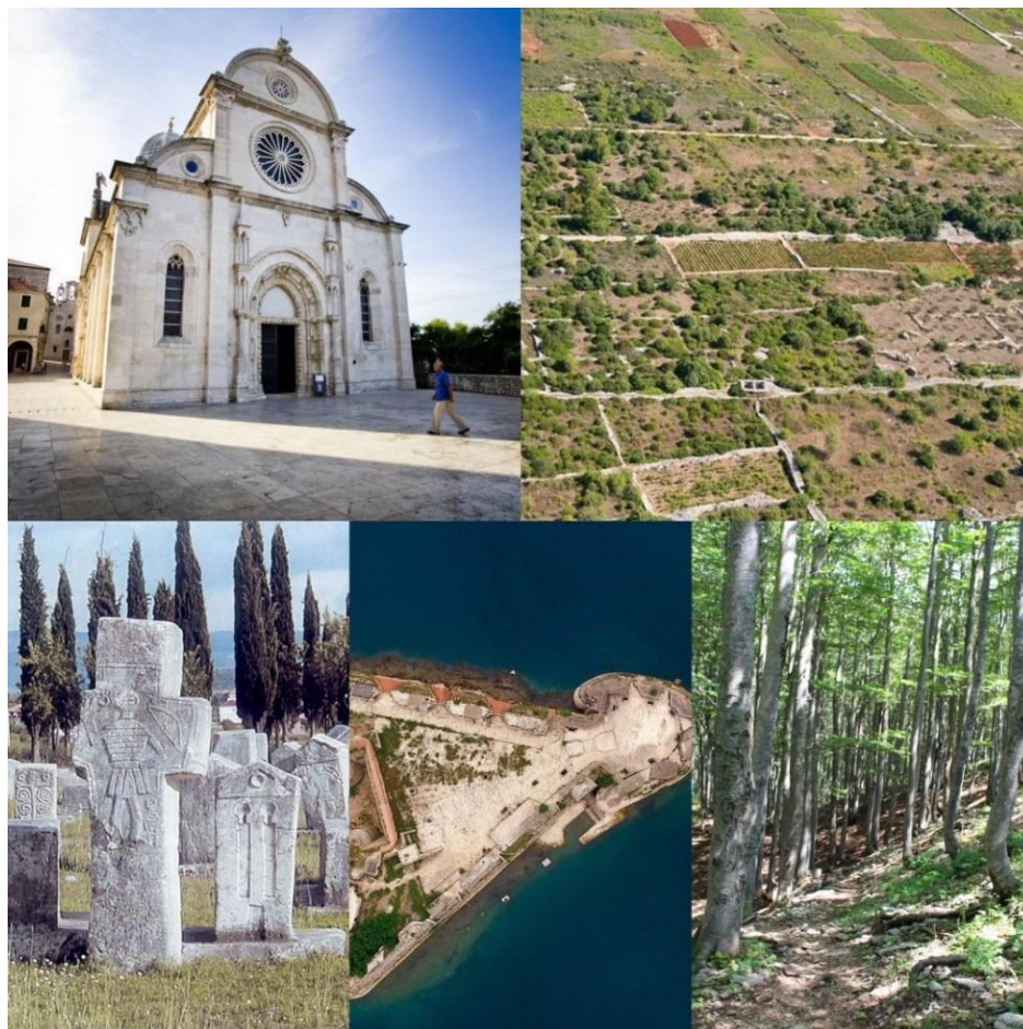
Slika 9: Katedrala Sv. Jakova, starogradsko polje, stećci, obrambeni sustav Republike Venecije, bukove šume (s lijeva na desno, od gore prema dolje)