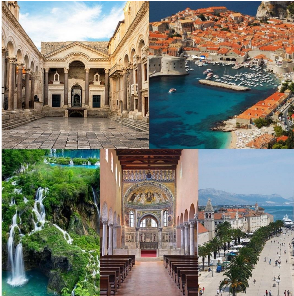
Slika 8: Dioklecijanova palača, grad Dubrovnik, Plitvička jezera, Eufrazijeva bazilika, grad Trogir (s lijeva na desno, od gore prema dolje)