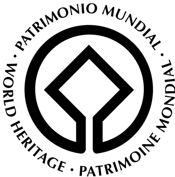
Slika 4: Logo Konvencije