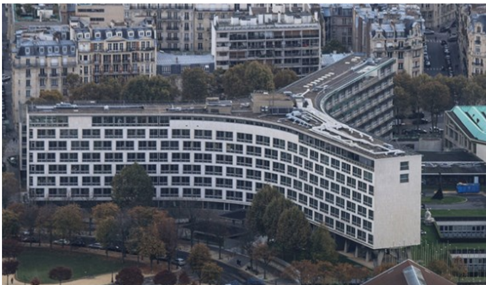
Slika 2: Kuća UNESCO-a