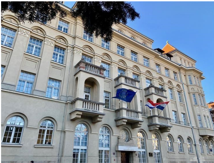
Slika 6: Ministarstvo kulture i medija