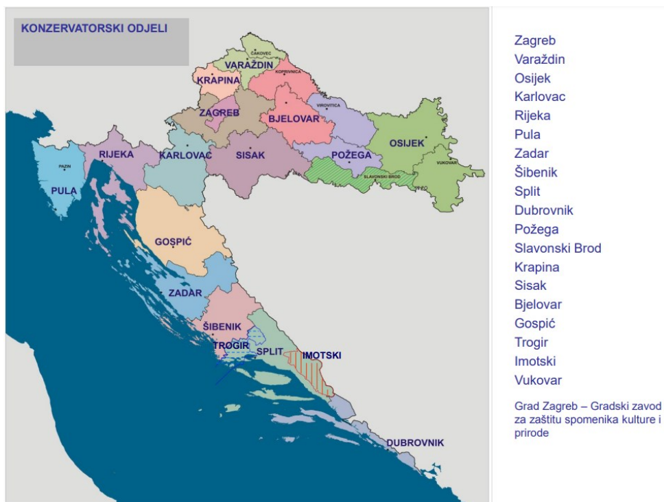
Slika 7: Konzervatorski odjeli ministarstva kulture