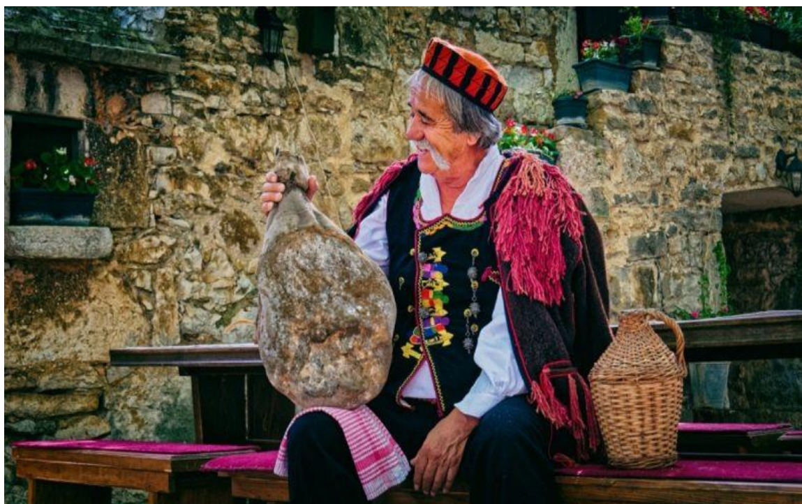
Slika 5. Međunarodni festival pršuta u Drnišu