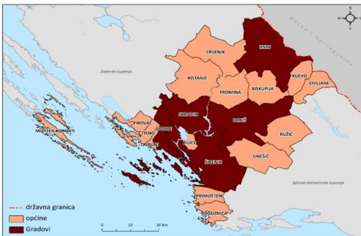
Slika 3. Administrativno teritorijalna organizacija Šibensko-kninske županije