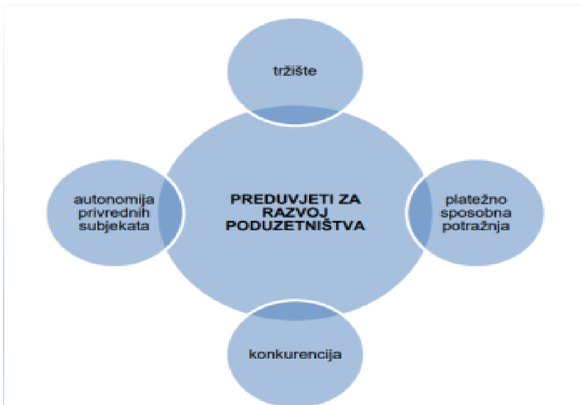
Slika 1. Osnovni preduvjeti razvoja poduzetništva