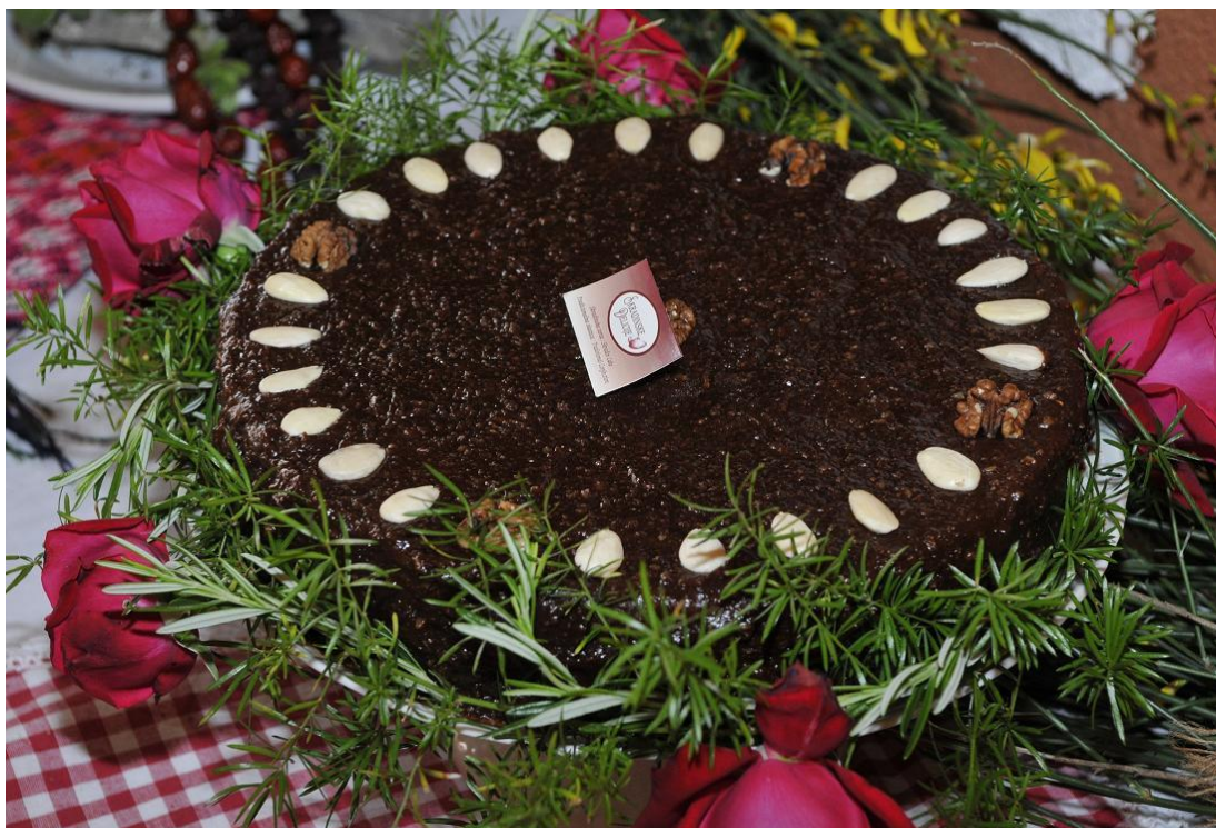
Slika 9. Izgled Skradinske torte