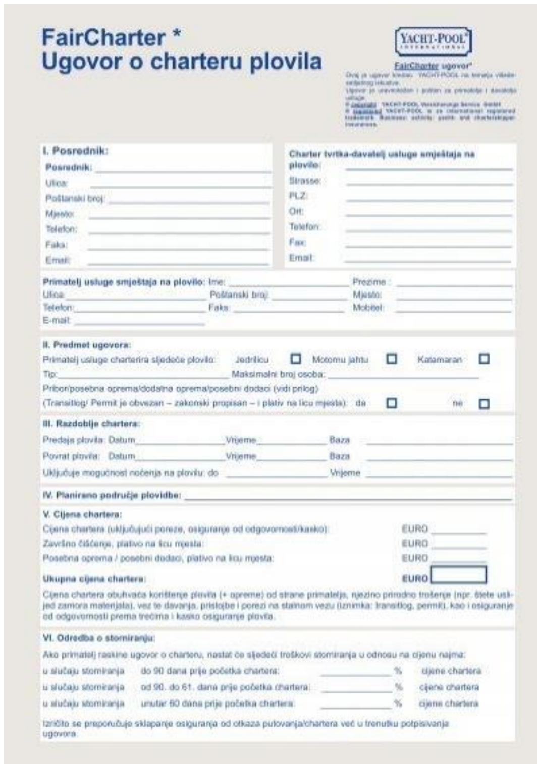
Slika 5. Ugovor o čarteru