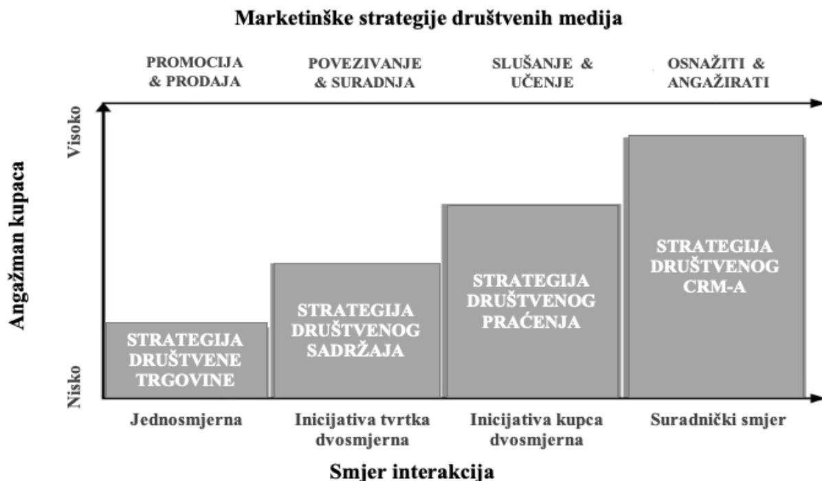
Slika 2 Marketinške strategije društvenih medija (Li et. al, 2021).

Prema navedena tri klasifikacijska kriterija možemo identificirati četiri različita marketinške strategije putem društvenih medija: strategija društvene trgovine, strategija društvenog sadržaja, strategija društvenog praćenja i strategija društvenog CRM-a.