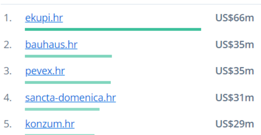
Slika 2. Poredak najpopularnijih e-trgovina u Hrvatskoj 2021.