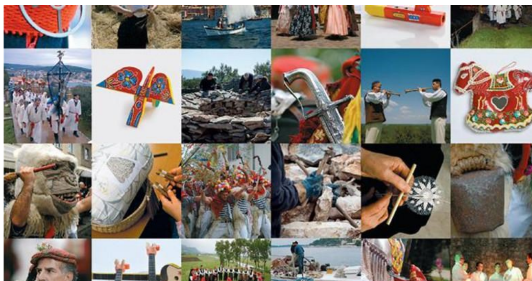
Slika 5: Očuvanje kulturne baštine