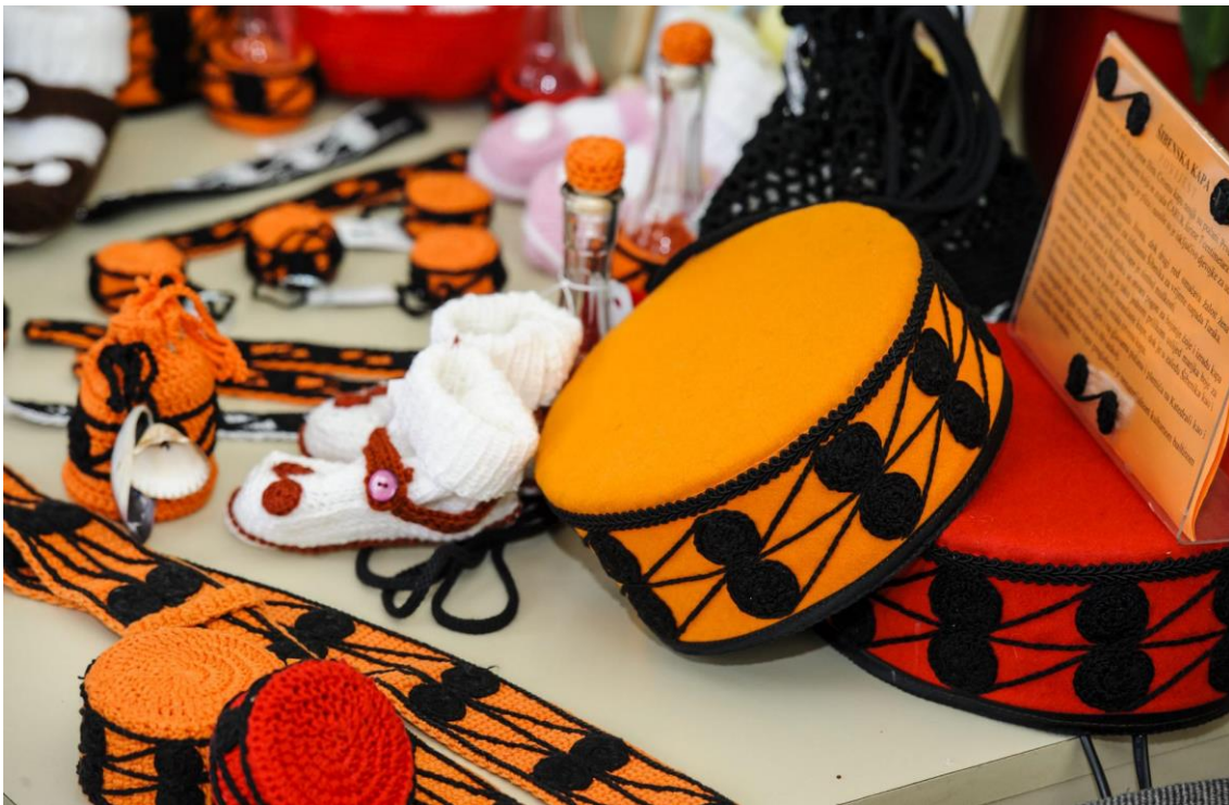
Slika 4. Suvenir Šibenska kapa

Izvor: Turistička zajednica grada Šibenika, https://www.sibenik-tourism.hr/ (10.07.2023.)