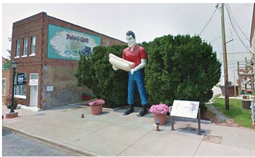
Slika 7. Statua Paula Bunyana u Atlanti