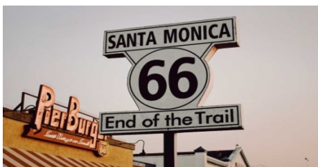
Slika 13. Kraj putovanja rutom 66 u Santa Monici

Na kraju putovanja rutom 66, Santa Monica u Los Angelesu smatra se službeno zapadnim završetkom rute 66, zvani kraj staze. Na kraju rute stoji znak kao jedan od napečatljivijih atrakcija cijelog putovanja (slika 13).