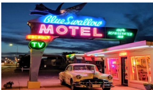
Slika 15. Motel Blue Swallow u Meksiku

Primjerice Ariston Caffè u Litchfieldu (slika 14), koji je otvoren 1924. godine i smatra se najstarijim restoranom na ruti 66, još je uvijek otvoren i poslužuje jela turistima. Hotel Big Chief, stari hotel otvoren je 1928. godine kao hotel sa 62 kabine za goste. Kabine su srušene, ali ostao je restoran koji je i danas u funkciji. Prodavaonica Williams u Rivertonu otvorena je 1925. godine i danas radi i popularno je turističko odredište, a prodavaonica je poznata kao jedna od najstarijih prodavaonica na ruti 66. Rock Caffè u Stroudu otvoren je 1939. godine, a nekoliko puta je transformiran, navodi Petanjek (2014). Nakon Drugog svjetskog rata pretvoren je u autobusnu postaju za hrtove, a nakon požara 2008. godine u restoran sa hamburgerima.