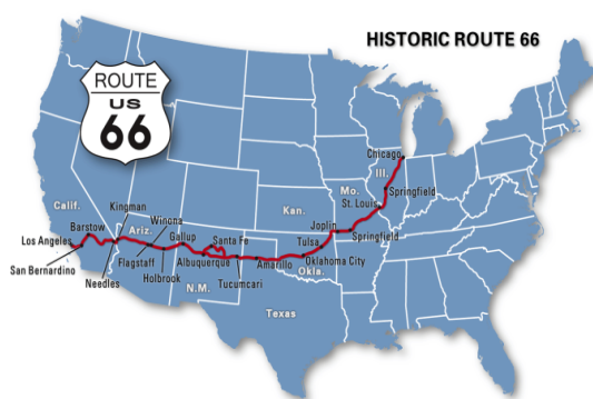
Slika 1. Karta Route 66