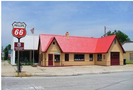
Slika 11. Benzinska postaja Baxter Springs u Kansasu