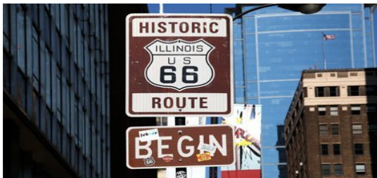
Slika 10. Povijesni znak početka rute 66