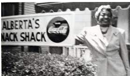
Slika 5. Albertin hotel u Springfieldu