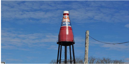
Slika 9. Boca ketchupa Catsup u Collinsvillu