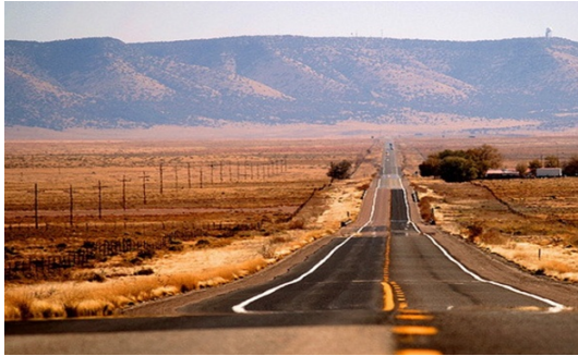
Slika 2. Izgled Route 66