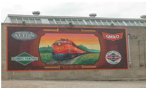
Slika 8. Ručno izrađen vagon u Lincolnu