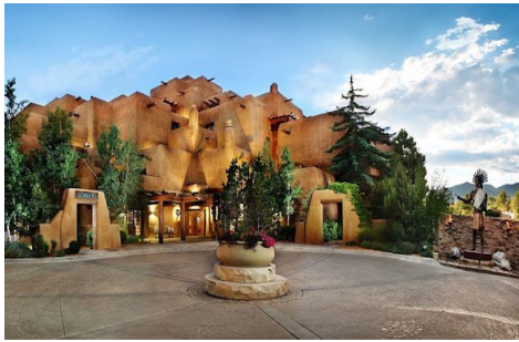
Slika 21. Gostionica i spa u Santa Feu u Novom Meksiku