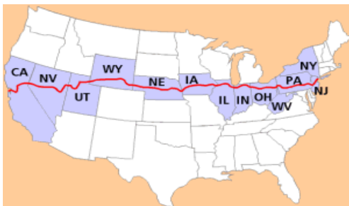
Slika 4. Karta koja prikazuje rutu Linconove ceste