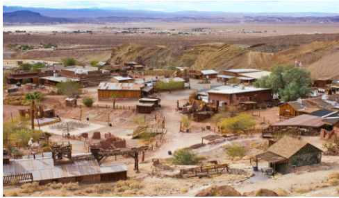
Slika 20. Grad Calico Ghost Town u pustinji Mojave