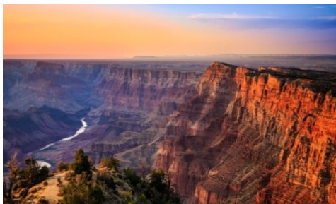
Slika 12. Nacionalni park Grand Canyon