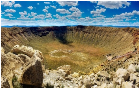
Slika 18. Meteorski krater u Arizoni