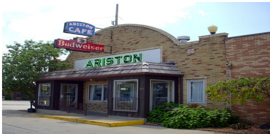
Slika 14. Caffè Ariston u Litchfieldu