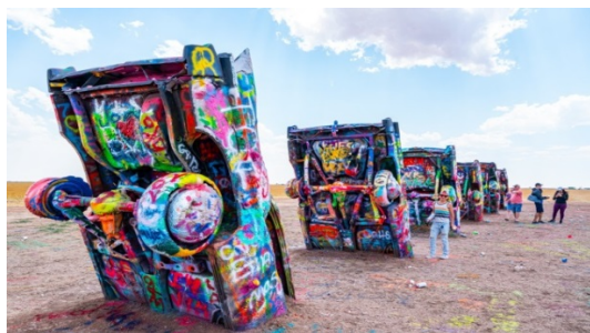
Slika 6. Ranč Cadillaca u Amarillu