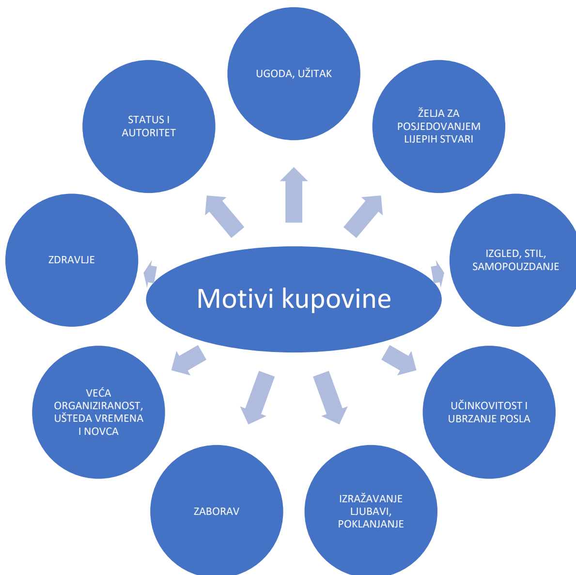
Slika 3. Motivi kupovine.