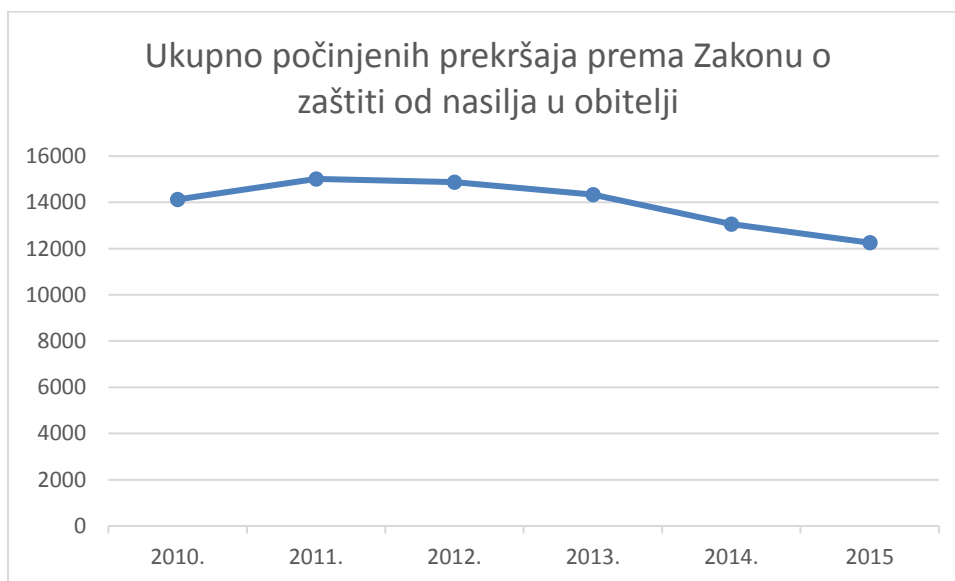
Slika 2. Ukupan broj počinjenih prekršaja prema Zakonu o zaštiti od nasilja u obitelji

Podaci preuzeti su iz statističkih pregleda temeljnih sigurnosnih pokazatelja i rezultata rada Ministarstva unutarnjih poslova Republike Hrvatske za razdoblje od 2010. do 2015. godine se odnose na prekršaje počinjene prema Zakonu o zaštiti od nasilja u obitelji (MUP RH 2010, 2011, 2012, 2013, 2014, 2015). Iz Slike 2. je vidljivo kako broj ukupnih počinjenih prekršaja kao i počinitelja istih opada u razdoblju od 2010. do 2015. godine odnosno 2010. godine taj broj je iznosio 14.129 dok je šest godina kasnije, 2015. godine ta brojka pala na 12.255.