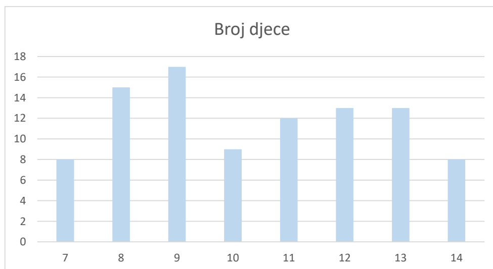
Grafikon 2: Prikaz dobi djece