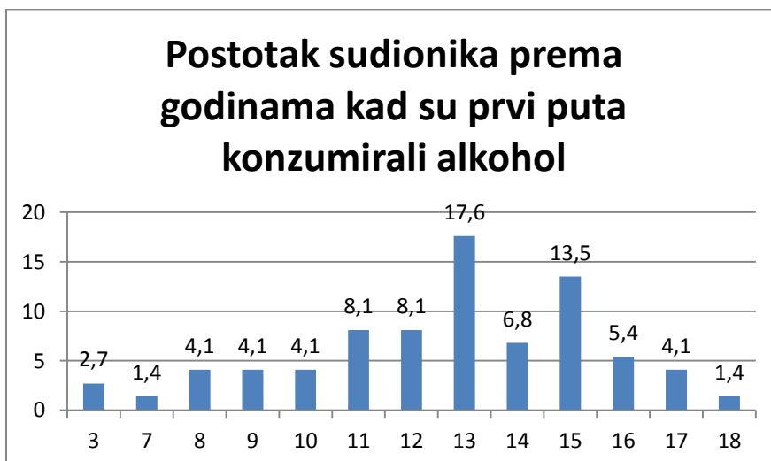
Grafikon 2. Postotak sudionika prema godinama kada su prvi puta konzumirali alkohol