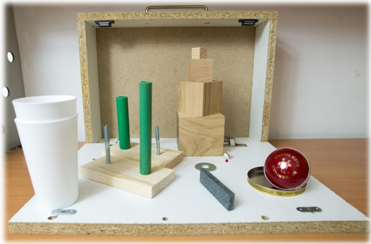
Slika 3 Action Research Arm Test

ARAT je vrlo osjetljiv i precizan mjerni instrument za diferencijaciju osoba s blagim do umjerenim motoričkim oštećenjima gornjih ekstremiteta nakon moždanog udara (Chen i sur., 2012). Nordin i sur. (2014) ističu kako je ARAT pouzdan mjerni instrument za opservaciju funkcije ruke i šake kod osoba koje su doživjele moždani udar. Nadalje, ovaj instrument je koristan za procjenu motoričke funkcije gornjih ekstremiteta kod osoba tijekom oporavka ili nakon liječenja (Chen i sur., 2012).