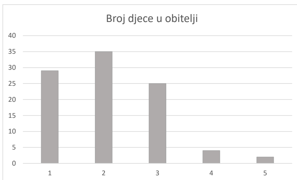
Grafikon 1: Prikaz broja djece u obitelji

Istraživanjem su obuhvaćeni roditelji raznih stupnjeva školske spreme: osnovno obrazovanje (N=2), strukovno obrazovanje (N=2), trogodišnje strukovno obrazovanje (N=22), gimnazijsko srednjoškolsko ili četverogodišnje i petogodišnje strukovno srednjoškolsko obrazovanje