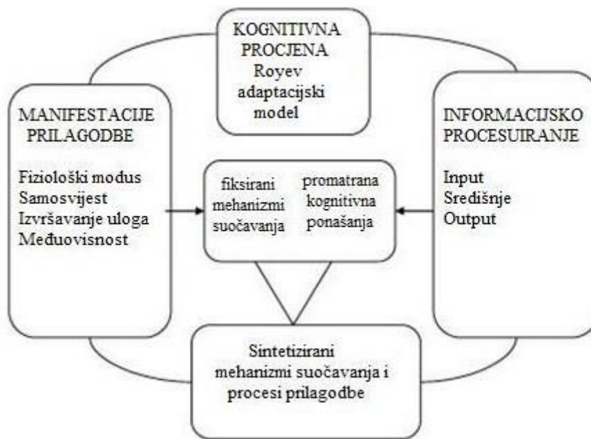
Slika 1. Roy adaptacijski model