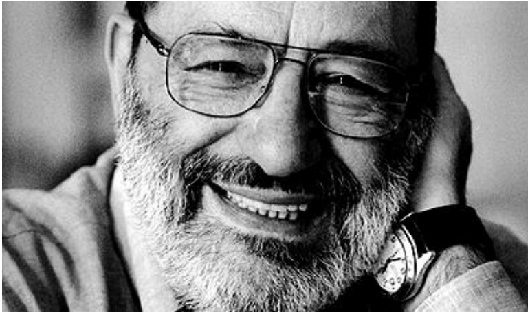
Prilog 1: Umberto Eco