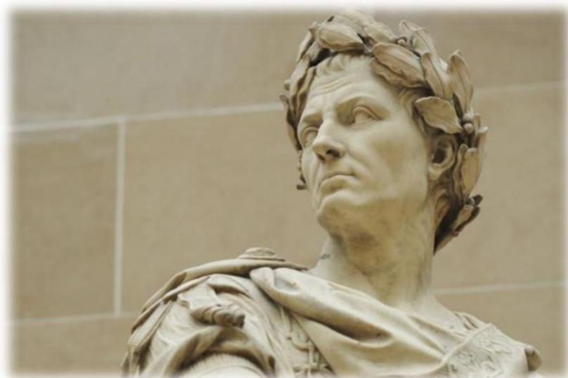
Slika 2 - Gaj Julije Cezar

Gaj Julije Cezar, rodom iz patricijske obitelji Julijevaca za koje legenda kaže da potječu od samoga Eneje, trojanskog junaka, rodio se 13. srpnja 101. g. pr. Kr. Malo je toga poznato o njegovom djetinjstvu. Otac istoga imena umire dok je Cezar bio mlad, pa odgoj preuzima njegova majka Aurelija. Kao nećak slavnog