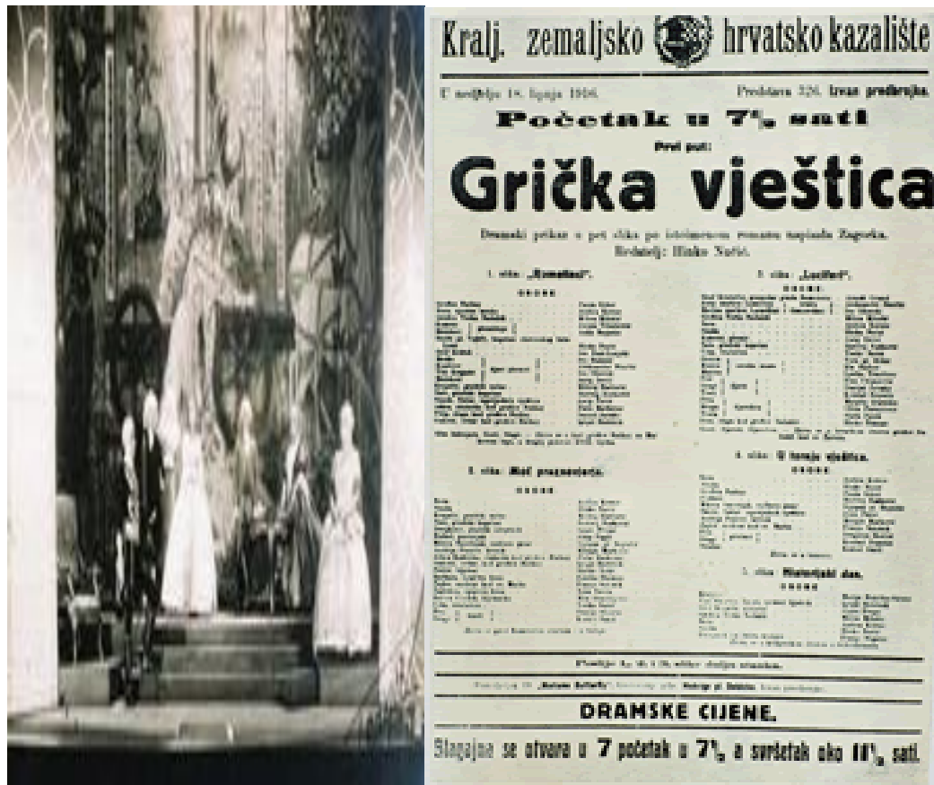
Slika 1. Grička vještica , obnova iz 1929. godine 54