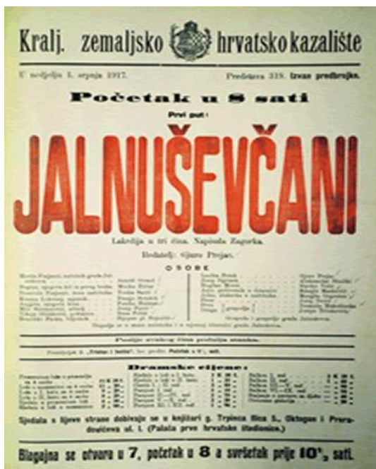
Slika 2. Jalnuševčani , obnova iz 1943. g. 55