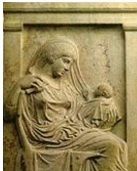
SLIKA 2. Mlada žena sa sinom, 410.g.pr.Kr.

Kontinuitet obitelji ovisio je o životnom ciklusu žene, a na porođaj se gledalo kao na vrlo opasan proces u kojemu žena riskira svoj život. Ona žrtvuje sebe u korist produžetka potomstva, moguće je kako su zato žene preminule pri porođaju bile slavljene jednako kao i junaci poginuli u bitci. Čini se kako je žena morala preminuti kako bi joj se priznala ta njezina važna uloga. Česti su bili slučajevi da žene uspješno prođu kroz porod, ali ih on toliko oslabi da su kasnije često bile bolesne i iznemogle. Bile su podložne groznicama i različitim epidemijama zbog kojih je i smrtnost bila velika. Problem je bio i u tome što je većina majki bila vrlo mlada i zbog toga su trudnoće bile rizične. Također su trudnoće bile vrlo česte, primjerice začele bi vrlo brzo nakon poroda. Nakon porođaja dijete ostaje majci na brigu. Otac je njegov skrbnik i ima vlast nad njim, ali majka je ta koja ga odgaja i njeguje. Osim toga, njoj pripomažu i druge žene koje žive u kućanstvu. 66 Primjerice, u Rimu iako su se brinule o djeci, žene nekada nisu same dojile nego su za to imale dojilje surogate, sluškinje ili