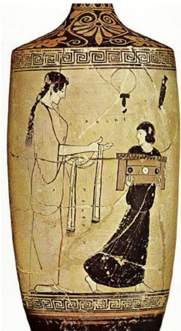
SLIKA 4, Atički lekythos, žene u svakodnevnom životu

Mnoštvo je vaza i vrčeva na kojima su sačuvane slikarije s prizorima svakodnevnog života. Tako je i mnogo prikaza žena u njihovim dnevnim poslovima, primjerice dok predu vunu ili tipične scene iz obiteljskog života. Na posudama i ostalim oslikanim predmetima često se prikazivalo muškarce i žene u interakciji, gdje su žene bile redovito bez vela, a poznato je da žene nisu izlazile nepokrivene i da na većini događanja nisu bile prisutne. Ako su te slikarije bile odraz ondašnje realnosti tko su onda te žene koje su u tako slobodnoj interakciji s muškarcima? Iako možemo pretpostaviti da su žene prikazane na vazama vjerojatno prostitutke takva objašnjenja nisu dostatna. Ponekad su to pogrebne scene ili scene vjerskih rituala na kojima su žene smjele pristustvovati. 135