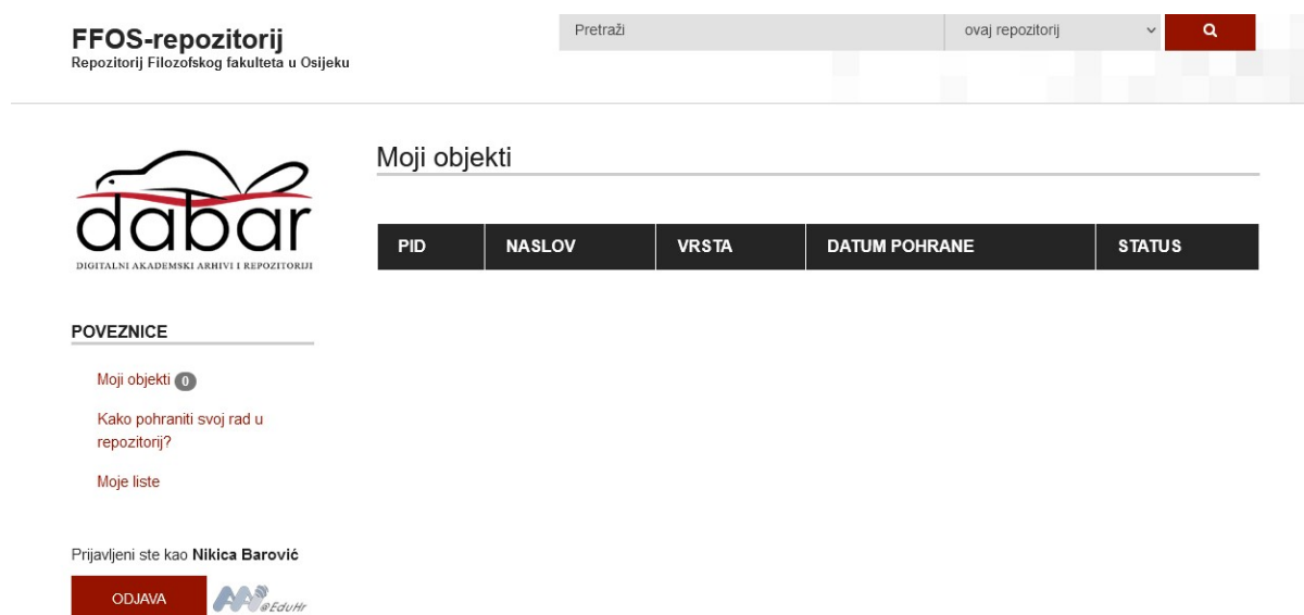
Slika 2. Stranica koja se prikazuje prilikom ulaska u sustav FFOS-repozitorija 32

Kako je repozitorij izrađen pod sustavom Dabar, korisnici, ponajprije studenti, prijavljuju se preko svoje AAI@EduHr domene, nakon toga mogu vidjeti popis svojih objekata ako su ih prethodno postavili. 31