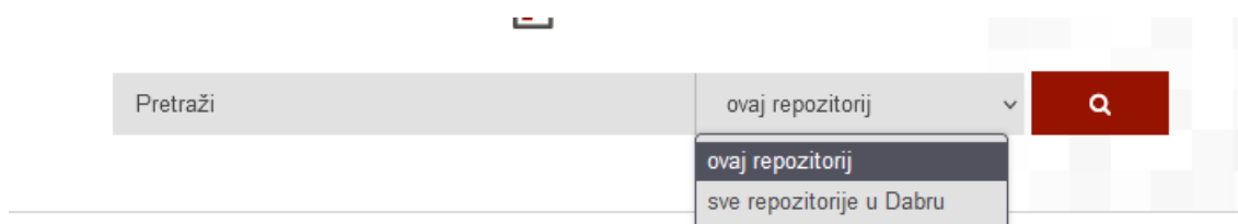
Slika 7. Tražilica 52

Ukoliko korisnik želi doći do brze informacije odnosno, nije mu potreban specifičan rad, u tom slučaju u gornjem centralnom dijelu stranice uvijek stoji prikazana tražilica bez obzira na kojoj podstranici se korisnik nalazi. Korisnik ima mogućnost pretraživati repozitorij Filozofskog fakulteta u Osijeku, ali može i pretraživati po svim repozitorijima u Dabru. 51