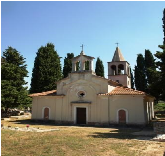
Slika 1. Fotografija župnog ureda Žman 27