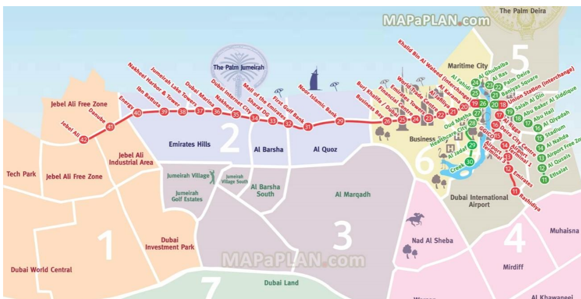
SLIKA 2 Plan vožnje metroa

Prilikom izgradnje važnu ulogu imala je klima. Naime, Dubai se nalazi na pustinjskom području gdje temperatura ljeti prelazi 40°, ponekad 50°C stupnjeva, dok se zimi kreće oko ugodnih 25 °C. Kako bi osigurali dolazak posjetitelja i u vrijeme vrućih ljetnih mjeseci većina turističkih atrakcija smještena je u zatvorenom prostoru, u strogo kontroliranim uvjetima s