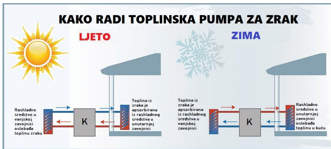
Slika 4. Princip rada toplinske pumpe za zrak