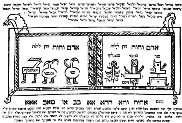
Slika 5: Amulet s tri anđela koji zarobljavaju vješticu Lilit. Amsterdam, 1701.

Ova se verzija mita ubrzo proširila kod svih pripadnika židovske vjere i poprimila brojne varijante. Tako je ona, prema Goldsteinu, uz Samaela ona jedan od dva arhidemona