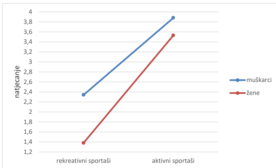
Slika 3. Motiv natjecanja s obzirom na spol i status sportaša

Motiv za natjecanjem izraženiji je kod aktivnih sportaša, pri čemu su muškarci i žene podjednako isticali ovaj motiv. Kod rekreativnih sportaša, motiv za natjecanjem izraženiji je kod muškaraca nego kod žena.